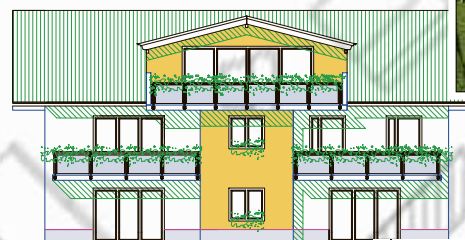
Projekt Predigtstuhl, Neubau von vier Eigentumswohnungen, 2, 3, 5 Zimmer- oder Loftwohnungen von 75-115m 2 .