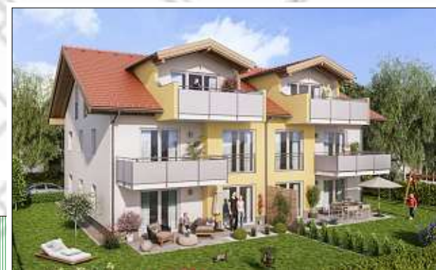
WohnRaum Barbarossa, Neubau von sechs Eigentumswohnungen mit Tiefgarage in Salzburghofen, 2 und 3 Zimmer Wohnung von 75-90m 2 , wahlweise mit Garten, Balkon oder Dachterrasse.